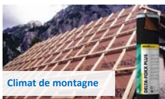
Climat de montagne

Écran de sous-toiture hautement perméable à la vapeur d'eau (HPV) tricouche. Supports continus ou discontinus (entraxe jusqu'à 60 cm). Version PLUS avec bords autocollants. Pour climat de plaine (< 900 m). Homologation du CSTB n°11-056. Rouleau de 50 m x 1,50 m.