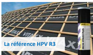
La référence HPV R3

Écran de sous-toiture hautement perméable à la vapeur d'eau (HPV) avec bords autocollants étanche à l'air par l'extérieur, étanche au vent, étanche à l'eau, avec stockage et restitution progressive de l'humidité intérieure. Supports continus ou discontinus (entraxe jusqu'à 90 cm). Pour climat de plaine (< 900 m). Rouleau de 50 m x 1,50 m.