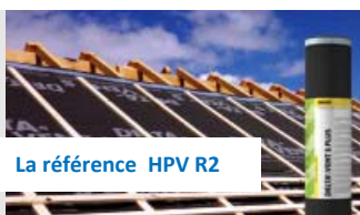
La référence HPV R2

Écran de sous-toiture hautement perméable à la vapeur d'eau (HPV) quadrilayers armé. Supports continus ou discontinus (entraxe jusqu'à 90 cm). Version PLUS avec bords autocollants. Pour climat de plaine (< 900 m). Homologation du CSTB n°12-077. Rouleau de 50 m x 1,50 m.