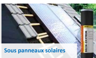
Sous panneaux solaires

Écran d'interposition pour toitures métalliques, hautement perméable à la vapeur d'eau (HPV). Structure à filaments désorientés hauteur 8 mm. Avec bords autocollants. Pose sur support continu nécessaire. Rouleau de 50 m x 1,50 m.